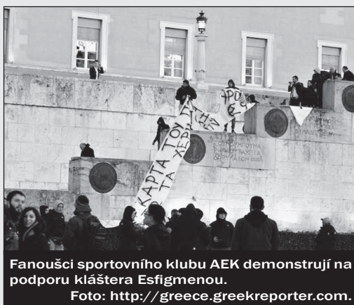
Fanoušci sportovního klubu AEK demonstrují na podporu kláštera Esfigmenou.

Do první kategorie byly nyní zařazeny Sýrie a Irák, kde se křesťanská populace v posledních letech značně zmenšila, křesťané byli buď zabiti, nebo donuceni svou vlast trvale opustit. Dále sem patří Nigérie kvůli pokračující kampani Boko Haram, jejímž cílem je křesťany v zemi zcela vyhladit. Jako poslední je v této kategorii jmenována Severní Korea, kde jsou křesťané vystaveni nepřítel-