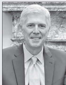
Čím naopak nový americký prezident náboženské konzervativce potěšil, bylo jmenování obránce náboženských svobod Neila Gorsucha do Nejvyššího soudu USA, čímž konzervativci získali v této důležité instituci převahu.

S tím nesouhlasí Francis DeBernardo, výkonný ředitel New Ways Ministry , organizace katolických homosexuálů, podle něhož je v nové vládě „hodně lidí s dlouhou historií anti-LGBT politiky a názorů včetně viceprezidenta Penceho“ a „ukazují zarážející nedostatek citlivosti k otázkám diverzity“. Vyjadřuje politování nad tím, že biskupové nechápou, že antidiskriminační nařízení je ve skutečnosti „naplňování učení církve o spravedlivém zachá-