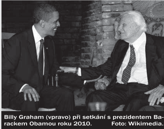
Billy Graham (vpravo) při setkání s prezidentem Barackem Obamou roku 2010.

Na projevení úcty u jeho ostatků jeho příznivci čekali v dlouhé frontě. O mimořádné popularitě evangelikálního vůdce vypovídají i data Gallupova institutu, který od roku 1948 každoročně uveřejňuje seznam osobností těšících se v americké společnosti největší vážnosti. Billy Graham zaujal místo mezi desítkou nejvá-