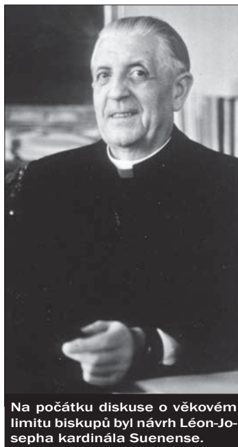
Na počátku diskuse o věkovém limitu biskupů byl návrh Léon-Josepha kardinála Suenense.

Těmito postupnými kroky došlo k zavedení dodnes platných věkových limitů pro rezignaci biskupů a dalších vyšších představených Římskokatolické církve. Již zmíněné motu proprio papeže Františka „Učit se odcházení“ z února 2018 obsahuje především pastorační pokyny k přípravě na novou životní fázi, která je spojena s podáním rezignace. Důležitým momentem je tvrzení, že v případě papežského rozhodnutí o přijetí rezignace se nejedná o automatický krok, který následuje po dovršení 75 let, ale jedná se o záleži-