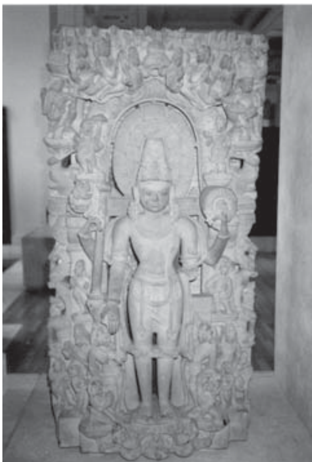
Reliéf Višnua s jeho avatáry (jižní Indie, 9. st.)

kulturním pozadím Kršnova náboženství. Nejde zde tedy ani tak o hodnocení a uvažování o užitečnosti či nebezpečnosti tohoto východního náboženství v našem prostředí, ale spíše jen o snahu pro takováto hodnocení ze strany psychologů, sociologů nebo teologů poskytnout základní informace - proč a jak hnutí Haré Kršna vzniklo, co nabízí svým členům, jak vystupují na veřejnosti, jaké má vnitřní problémy apod.