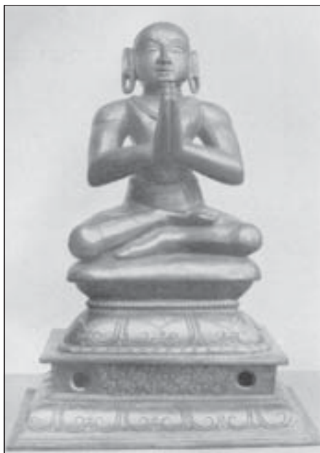
Kultovní soška Ráamándži

Bhaktisiddhánta Sarasvatí se sám nedočkal toho, že by se Kršnovovo jméno zpívalo podle přání Šrí Čaitanji po celém světě. Byli to jeho žáci, kteří ukázali, že sankírtan není omezen žádnými hranicemi zemí a národů.