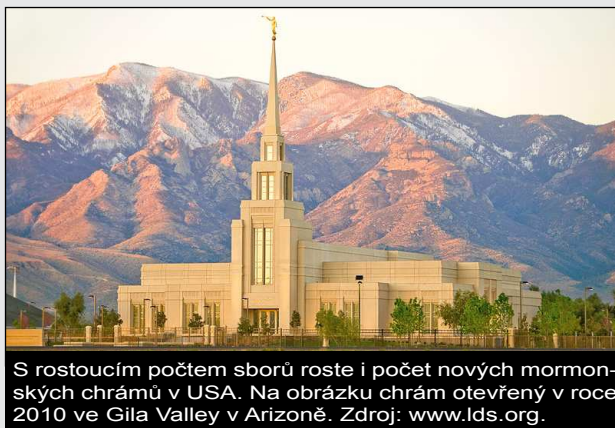
S rostoucím počtem sborů roste i počet nových mormonských chrámů v USA. Na obrázku chrám otevřený v roce 2010 ve Gila Valley v Arizoně.

Počet nábožensky aktivních muslimů v USA stoupl za posledních deset let o 67 % (2,6 mil). Je to zapříčiněno demografickými faktory, ale i větší aktivitou muslimských komunit po roce 2001. Spoluautor studie Dale E. Jones k tomu poznamenává, že protimuslimské nálady po 11. září přispěly k tomu, že se náboženství