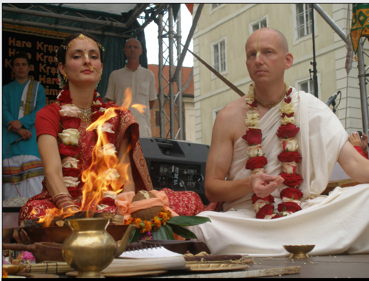
Védská svatba na pražském Ovocném trhu.

a sportovní výkony. Aktivní oddaní nadále připomínají veřejnosti svého guru částým pořádáním koncertů a meditací v jeho duchu. Na přelomu května a června pak do Česka přivezli letáky a plakáty masivně propagovanou putovní výstavu „Zvedání světa srdcem jednoty“.