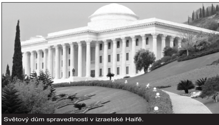
Světový dům spravedlnosti v izraelské Haifě.

Víra bahá'í se sama označuje za nové paradigmatické náboženství 17 s výrazně univerzalistickými rysy. Toto označení souvisí s tendencí tohoto náboženství transformovat stávající strukturu společnosti ve smyslu mírového světového řádu. Shoghi Effendi tuto změnu nazývá revolucí a předvídá dalekosáhlé změny ve struktuře společnosti, jichž nebude dosaženo pouze prostřednictvím běžných procesů politiky a vzdělávání. 18 Revoluční průběh změn přirovnává k procesu sjednocování jednotlivých států do federace v USA. Dále uvádí, že bahá'í nemají v úmyslu stávající řád reformovat, ale vytvářet nenásilným způsobem řád nový, a to v rámci řádů již existujících. Věřící, že se jim podaří postupně prosadit jejich vlastní metody, které povedou k transformaci v bahá'í světový řád, a to