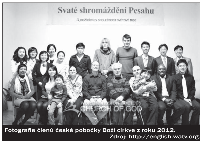
Fotografie členů české pobočky Boží církve z roku 2012.