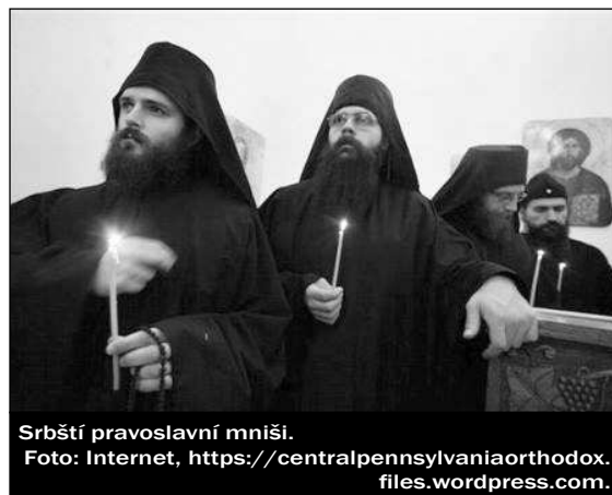
Srbští pravoslavní mniši.

Řeholní kongregace jsou poněkud volnější novověká seskupení osob s řeholními sliby. Jsou často silně specializované, např. salesiáni dona Boska na práci s mládeží. Vnějšíkově se rovněž snaží nelišit od svých spoluobytel. Kongregace nejsvětějšího Vykupitele, tedy redemptoristé, se věnuje tzv. lidovým misím.