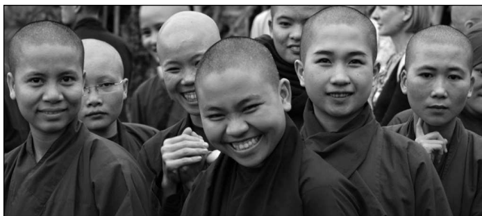
Buddhistické mnišky. Foto z filmu „The Buddha's Forgotten Nuns“, Budaya Productions.

vdaná se stará o světské věci, jak by se zalíbila muži. ... Ale kdo je v nitru pevný, nic ho nenutí, má v moci svou vlastní vůli a pevně se rozhodl, že se s ní neožení, jedná dobře. Takže kdo se ožení se svou snoubenkou, jedná dobře, ale kdo se neožení, udělá lépe. (srov. 1 Kor 7, 7–38)