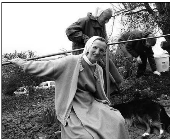
Foto z evangelické komunity diakonek Zionsberg v Německu, http://www.unserekirche.de .

Církev vzešlá z reformace 16. století zpočátku řeholní život odmítly. Ve 20. století však začaly vznikat protestantské řeholní komunity u anglikánů, v luterských