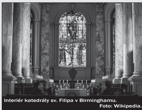
Interiér katedrály sv. Filipa v Birminghamu.