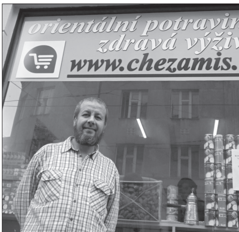
Pan Amis svůj obchod s orientálními potravinami v centru Prahy provozuje již od roku 2002. Díky kvalitě zboží a vřelosti v jednání se zákazníci se stal oblíbeným a vyhledávaným mezi sousedy ve čtvrti, studenty z nedaleké Pedagogické fakulty Univerzity Karlovy a také muslimy žijícími v širší Praze. Občas se prý stane incident, kdy mu někdo začne spílat do cizince. Většinou prý ale stačí ukázat českou občanku, aby si takový člověk uvědomil, že je v Česku jako zbožný muslim již hodně dlouho doma stejně jako všichni ostatní.

mešita pražská. Portál e-islam.cz nabízel třeba českou mutaci islámské internetové akademie pro ženy, která „funguje pod dohledem učenců v Saúdské Arábii.“ 55