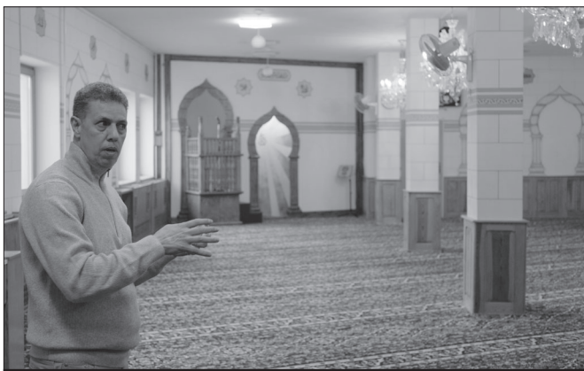
Pražská mešita na Černém Mostě v Blatské ulici byla otevřena v roce 1999. Tradičně je vstřícná vůči veřejnosti a každoročně pořádá exkurze pro školní skupiny z řad nemuslimů.